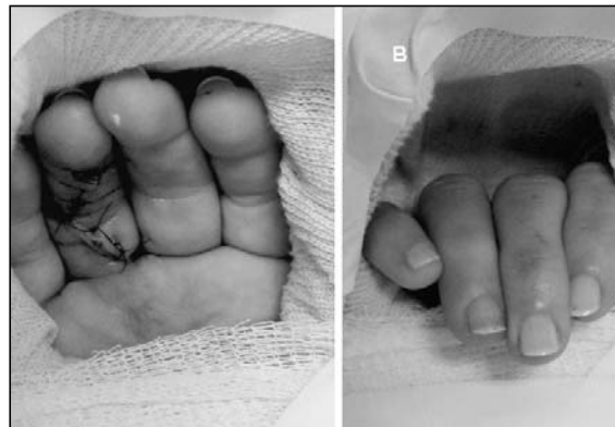
Figura 4. Protección de la reparación mediante la colocación en el postoperatorio inmediato de una valva con la muñeca flexionada 30°-45° y las articulaciones metacarpofalángicas en 60°-70° de flexión (A), permitiendo la flexión activa de ambas articulaciones interfalángicas (B).

Durante el postoperatorio se implementó un protocolo de rehabilitación que incluyó la movilización activa y pasiva temprana a las 48hs postoperatorias ( Tabla I ), protegida por el bloqueo dorsal de la muñeca y los dedos durante un período de 6 semanas ( Figura 4 ). Se realizó un control de la evolución por el médico cirujano y la terapeuta ocupacional 2 a 3 veces