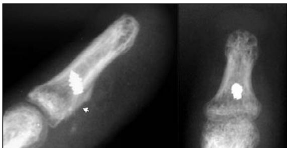
Figura 5. Radiografías postoperatorias inmediatas de frente y perfil de la falange distal, observándose la posición del arpón y el cruentado de la cortical palmar en la zona de inserción (flecha).