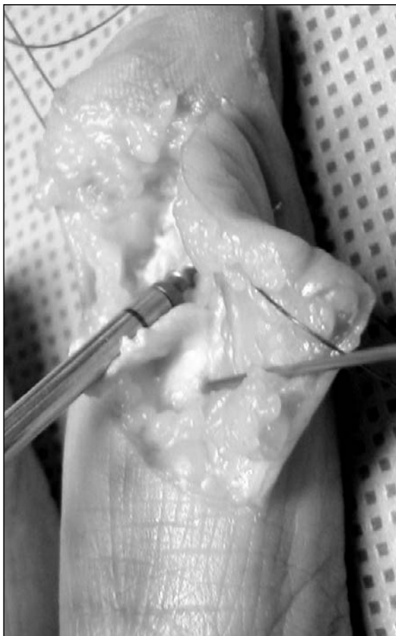
Figura 3. Se cruenta la cortical palmar de la falange distal en la zona de inserción tendinosa y se realiza la colocación del arpón roscado con la sutura incluida.

ción tendinosa hasta obtener un lecho sangrante y se coloca el arpón de 2.0 mm con la inclinación necesaria para evitar atravesar la cortical posterior ( Figura 3 ). Se constata entonces la rigidez del implante tirando firmemente de la sutura pasada a través del arpón. Utilizando la sutura de polifilamento no reabsorbible calibre 3/0 incluida en el arpón, se realiza finalmente la reinserción del tendón mediante la técnica de Kessler modificada (2 bandas, nudo afuera). Se cierra directamente la piel con puntos separados de Nylon 4/0.