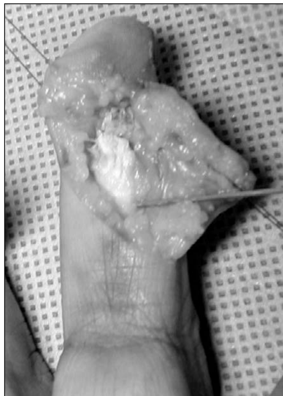
Figura 2. Incisión en zig-zag e identificación del tendón avulsionado, fijándolo con una aguja en posición para su reparación.

Durante el año 2004 se trataron 4 pacientes (3 hombres, 1 mujer) con avulsión tipo I del FDP, todos ellos incluidos en este trabajo. En 3 casos el dedo comprometido fue el anular y